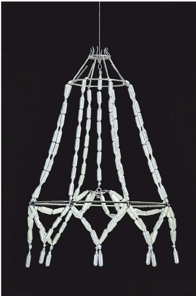
PAJAK xXx , 2019 van Tomasz Skibicki is gemaakt van gevonden lachgascapsules, roestvrijstalen draden, schroeven, trekhaken en staal. Het werk is te zien in de groepstentoonstelling Castlemania van Galerie Fleur & Wouter en No Limits! Art Castle tot en met 12 mei.

FOTO TOMASZ SKIBICKI/GALERIE FLEUR & WOUTER/SANDER VAN WETTUM